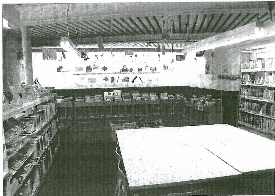
►► Una de les sales de lectura de l'equipament cultural.

Formada per una sola nau amb cinc capelles per banda. La coberta fou construïda amb embigat de fusta, suportada per quatre arcs diafragmàtics. Els contraforts quedaren incorporats als murs. L'edifici fou reformat en el segle XVIII. El 1827 els monjos abandonaren el convent, i amb la desamortització dels bens eclesiàstics dirigida pels ministres d'hisenda liberals (especialment Mendizábal), fou cedit a la Junta Municipal de Beneficència per instal·lar-hi l'hospital. El que era l'església, fou utilitzat durant molts anys com a magatzem per al gra, i posteriorment formà part de l'hospital. Finalment, el 1995 es va inaugurar com la nova biblioteca, obra del arquitecte, Lluís Vidal. ≡